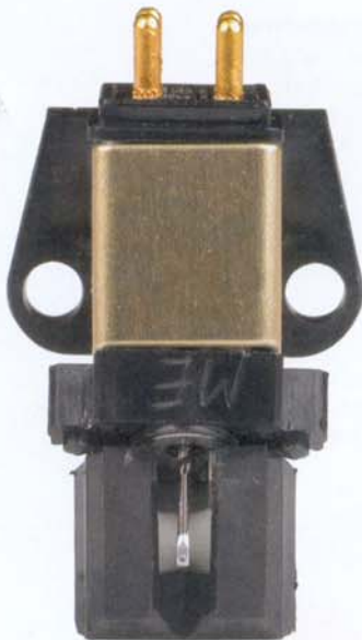
Der Nadeleinschub des Grado ME+ ist auswechselbar, ein Spezialwerkzeug liegt bei

Marrtzy / Fricsay Dvorak / Konzert für Violine und Orchester a-moll op. 53